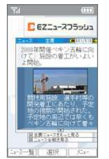
EZニュースフラッシュ