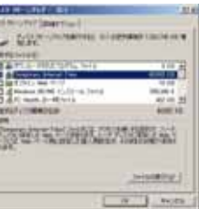
↑ディスククリーンアップ