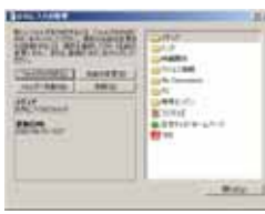
↑お気に入りの整理

まずデスクトップに散らばっているアイコンを整理します。起動時間を遅くする原因にもなります。次に自分で作成したファイルは一箇所に集めるように整理します。こうしておけばバックアップするときもファイルを探し集める必要がありません。あまり使わないファイルやフォルダは圧縮ツールを使って圧縮しておきます。MOやCD-Rに保存しておけばHDDの容量も稼げます。ずらりと並んだ「お気に入り」もフォルダに入れて整理すると見た目もスッキリします。（お気に入り お気に入りの整理）「お気に入り」はエクスポートを使いHTMLファイルにすると便利です。（ファイル インポートおよびエクスポート）BookMarks.htmというファイルが出来ますのでファイルをFDにコピーしておけば外出先や別のPCでも「お気に入り」が簡単に使えます。メールはメッセージルールを使って受信トレイを仕分けすると便利です。（ツール メッセージルール）「削除済みアイテム」